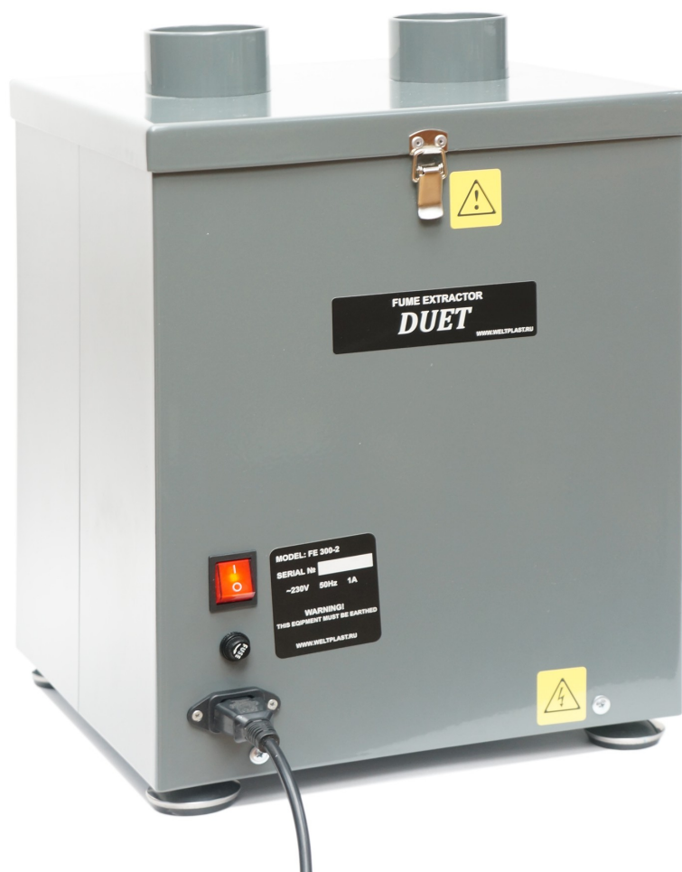
Рис. 1 Общий вид дымоуловителя "DUET" FE 300-2-(A)