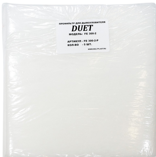
Предварительный фильтр - FE 300-2-P