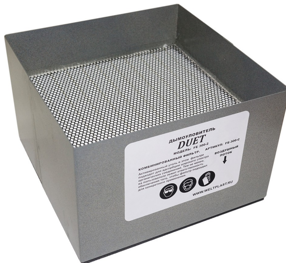
Комбинированный фильтр - FE 300-2-C